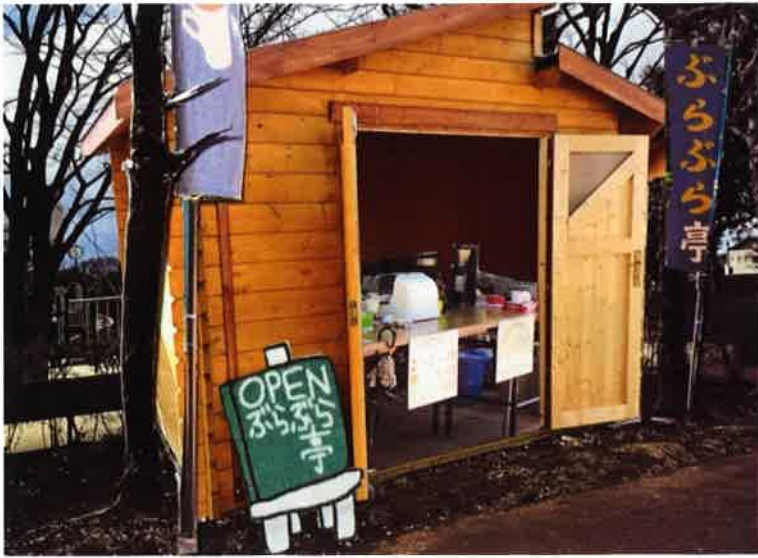
ぶらぶら亭 新ログハウス イメージ図 (合成写真)

3月20日からの春シリーズから改装ログハウスにて営業致します。皆様に愛される「ぶらぶら亭」を目指します。