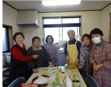
（根切サロンでの活動の様子）

お詫び：前号でご紹介した乙子改善センターサロンは誤りで、正しくは乙子集落センターサロンでした。