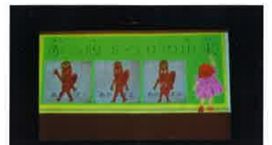
児童会運営委員会による「赤っ腹 まつりの由来」のパワーポイント