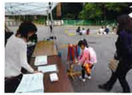
新入生の体験教室 「スタンプラリー」の受付