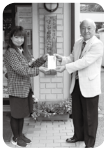
△古河ヤクルト様より