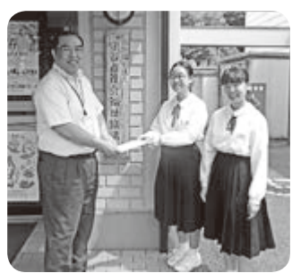
△昨年に引き続き、愛宕中学校吹奏楽部の皆さんより