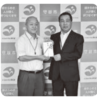
△山中統括工場長様より