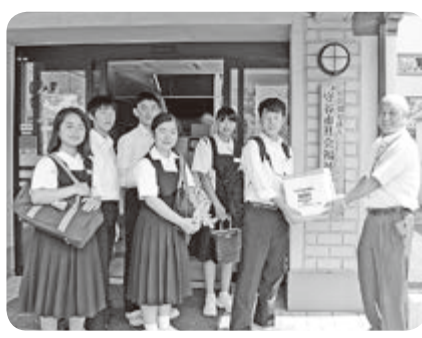
△守谷中学校生徒会の皆さんより