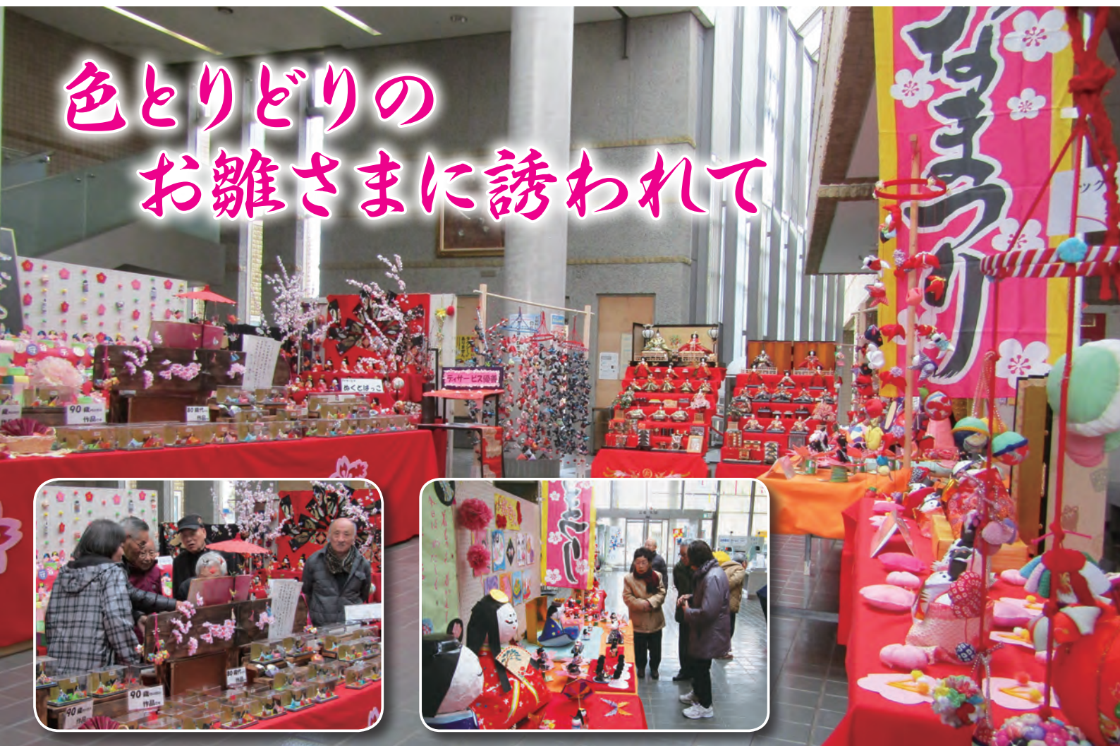
「もりやのおひなさま」