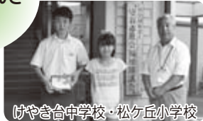
けやき台中学校・松ヶ丘小学校