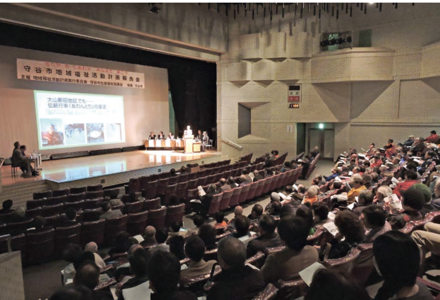
(守谷市地域福祉活動計画報告会)