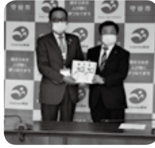
△今泉統括工場長様より 松丸会長へ