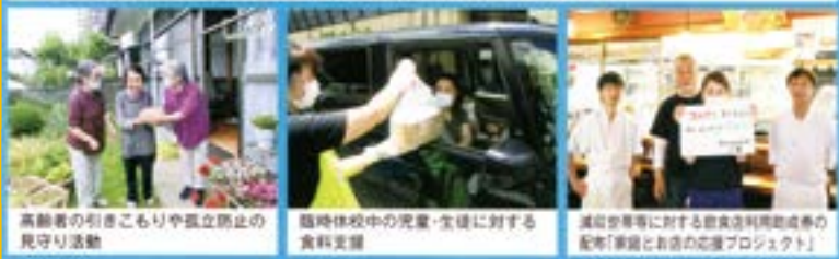
高齢者の引きこもりや孤立防止の見守り活動

赤い羽根共同募金は、コロナ禍の影響下で生活が困難な世帯や孤立した高齢者、日常生活に困難を抱える子どもとその家族など、困りごとを抱える人への緊急支援に活用されています。