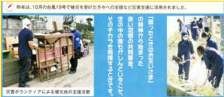
災害ボランティアによる被災地の支援活動