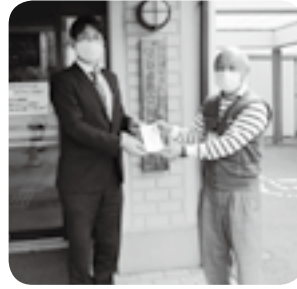
△宮島係長様より福祉ヤクルト売上げの一部を