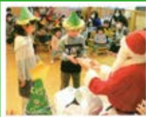
保育園等にサンタクロースを 派遣して、子育て世代を応援