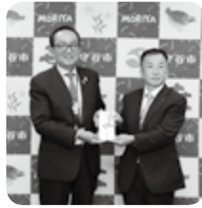
△今泉統括工場長様より松丸会長へ