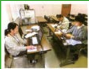
音訳テープを作成して、視覚 障がい者の日常生活を支援