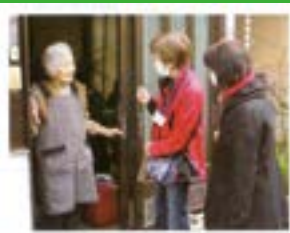
一人暮らし高齢者を訪問して、 安否確認と日常生活の支援