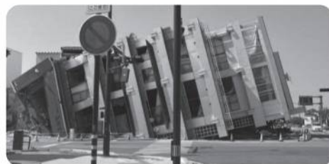
(6月中旬に職員が撮影)

半年近くたった今でも辛い想いをしている人たちを忘れないことが大切ではないでしょうか。