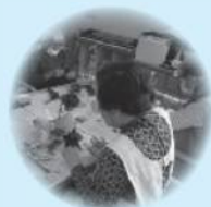
【フラワーアレンジメント】