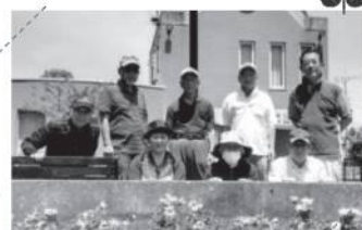
北守谷支部のみなさま (久保ヶ丘交番前花壇)

10年間「守谷市公園等里親事業」にて花壇整備を続けていただいている、守谷支部と北守谷支部が守谷市長から表彰されました。いつもきれいなお花を咲かせ続けてくださり、ありがとうございます！