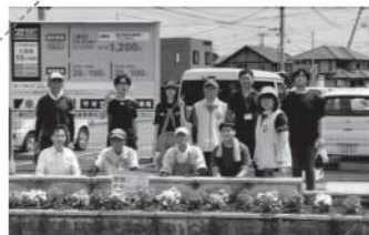
守谷支部と学生ボランティアのみなさま (常陽銀行守谷支店前花壇)