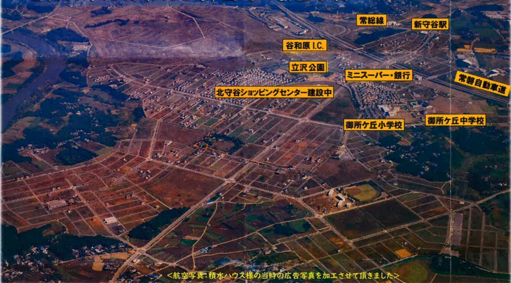
〈航空写真:積水ハウスの当時の広告写真を加工させて頂きました〉