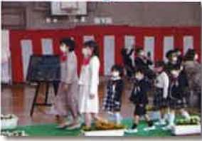
入学式もマスク着用で

学校生活では、休み時間をずらしたり、児童の帰宅後に机・椅子・ドアノブ・水道蛇口等、手の触れる部分の消毒などの感染予防対策を先生方が毎日行ってくださっています。