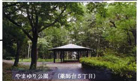
やまゆり公園 (葉師台5丁目)