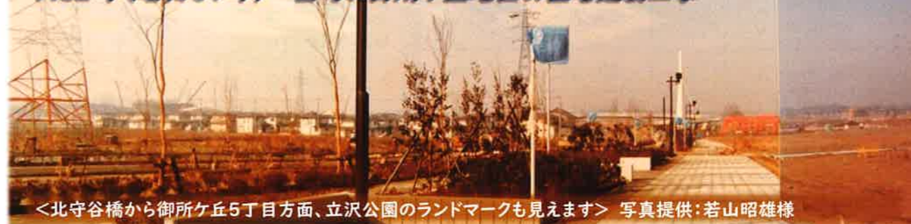
〈北守谷橋から御所ヶ丘5丁目方面、立沢公園のランドマークも見えます〉