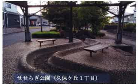
せせらぎ公園 (久保ヶ丘1丁目)