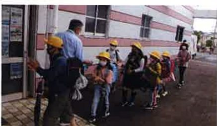
登校もマスクと手指消毒