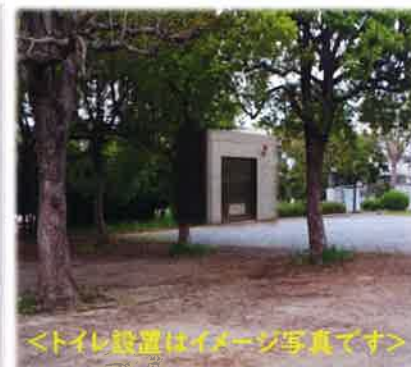
〈トイレ設置はイメージ写真です〉

令和元年度に守谷市まちづくり協議会提案制度で申請した「くわがた公園のトイレ設置」が3月の議会で正式に採用され、今年度中に設置されることになりました。これにより北守谷地区のシンボルである立沢公園・大山公園・くわがた公園を結ぶサイクル型の「遊歩道」を活用した住民のコミュニティ活動・防災活動・健康増進活動などの充実を図ることができます。このトイレ設置と合わせ住民からの要望のありました防犯カメラ設置の要望書を市に提出いたしました。