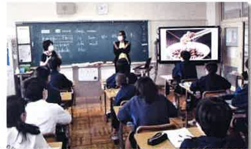
電子黒板を活用し、発声は最小限での授業。