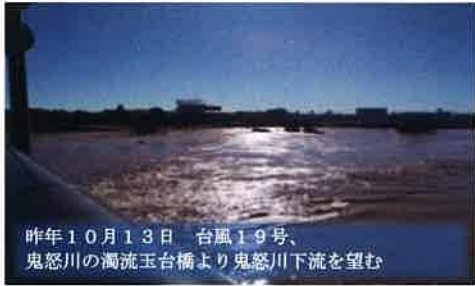
昨年10月13日 台風19号、鬼怒川の濁流玉台橋より鬼怒川下流を望む

鬼怒川緊急プロジェクトの一環で鬼怒川玉台橋から一里塚までの築堤工事が完成しました。場所は松前台3丁目と大山新田をつなぐ道沿いの一里塚の取水口付近から玉台橋までの往復約1.6km、夕焼けが川面に映り、反対側には筑波山が望めます。この堤防をぜひ散歩してみてください。北守谷には遊歩道が縦横に広がっており、体力に応じた色々なコースを安全に散歩できます。皆さんが発見した北守谷の新しいみどころ写真を編集部までお寄せ下さい。お待ちしております!