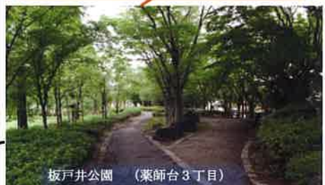
板戸井公園 (葉師台3丁目)