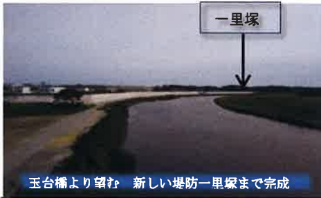
玉台橋より望む 新しい堤防一里塚まで完成