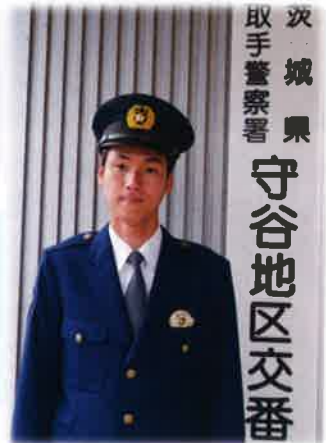
茨城県 取手警察署 守谷地区交番

北守谷連絡協議会からも回覧で注意喚起を促しておりますが、当地区で空き巣被害が連続して発生しております。守谷市の空き巣の半分は北団地内で発生しており、特に松前台、薬師台を中心に22件、前年比で15件も増加し、警戒感が高まっております。そこで今回は守谷地区交番、長澤所長にお話を伺いました。