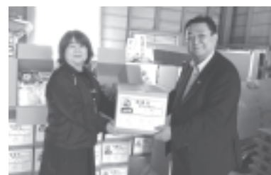
(株)セブンイレブン・ジャパン

※赤い羽根共同募金・歳末たすけあい募金にご協力いただきました方々のお名前は次号に掲載します。