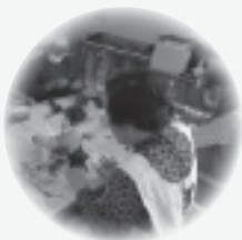
【フラワーアレンジメント】

お気軽にご連絡ください。 お待ちしております☆彡 お手伝いしてくれる方も募集しています。