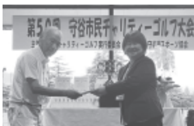
一般社団法人 守谷市スポーツ協会