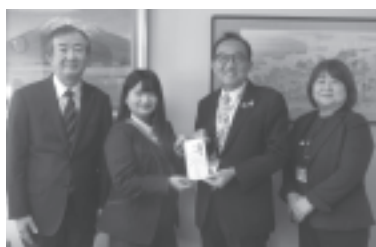
古河ヤクルト販売(株)